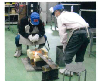
ガス溶接技能講習