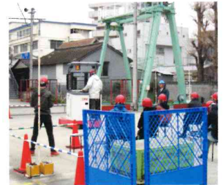
フォークリフト運転技能講習