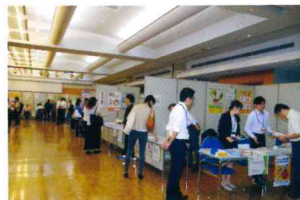
産業保健フォーラム