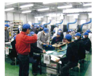
低圧電気取扱業務特別教育