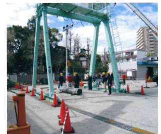
玉掛け作業主任者技能講習