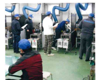
研削といし取替え等特別教育