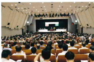
東京産業安全衛生大会