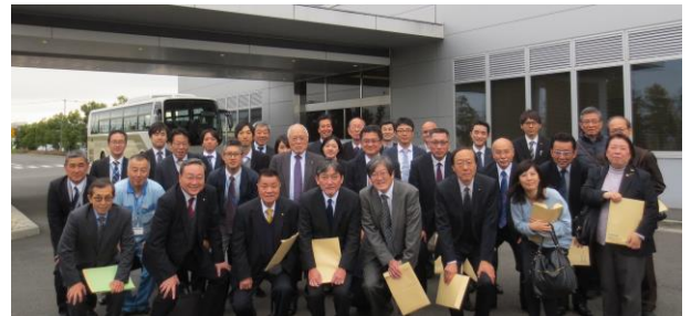
優良事業場見学会参加の皆様