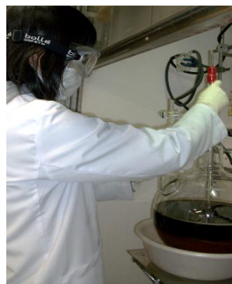
写真1. 保護具着用での実験

さらに、王子消防署にご協力いただき、毎年、非常時に備えて避難訓練、消火訓練、AED講習を実施することで安全対策に万全を期しています（写真2）。また、半年に1度、作業環境測定と特殊健康診断を実施することで健康管理にも努めています。加えて、産業医の先生と共に定期的に職場の巡回を行い、安全衛生面での改善点をご指導いただくことで、良好な作業環境の推進を図っています。