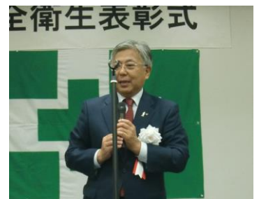
建設業労働災害防止協会東京 支部北分会 越野分会長