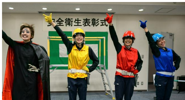
SG コスモスのみなさん方 (指さし呼称のサインです)