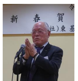
中締め 植野会計幹事