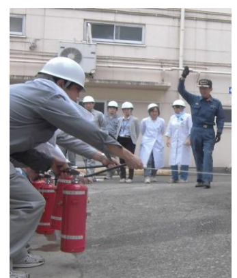
写真2. 消火訓練の様子