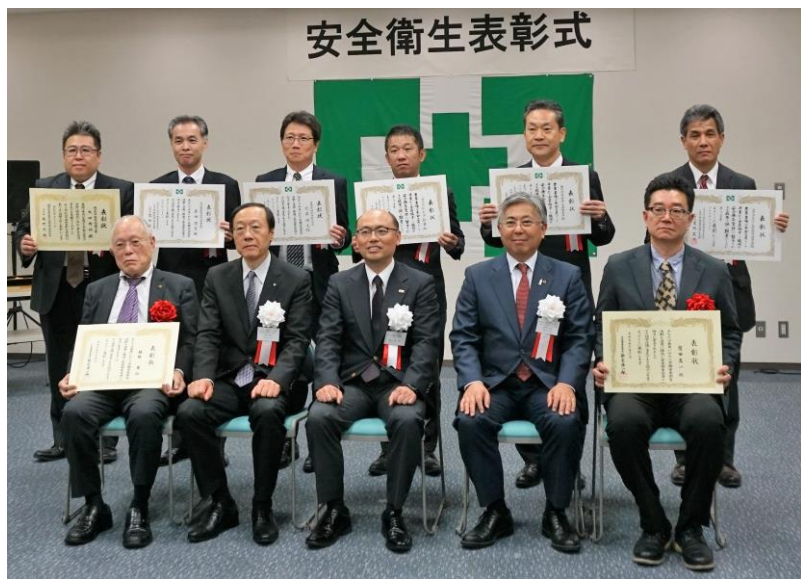
主催者と表彰された皆様方

令和元年11月11日(月)、令和元年度の安全衛生表彰式が(株)日刊スポーツPRESS王子工場研修ホールにて開催されました。