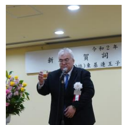
乾杯 土佐副支部長