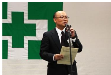
王子労働基準監督署 新名署長