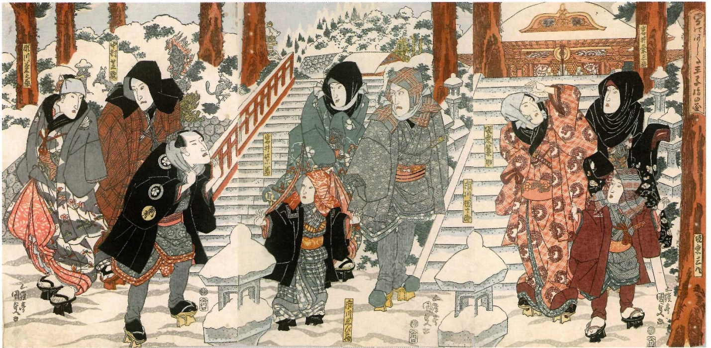
(浮世絵に描かれる北区) 雪のあした王子詣の図 (歌川国貞 1827年)

表紙の浮世絵は、六代目・市川海老蔵の宮参りを描いた作品です。背景には雪景色の王子稲荷社を描き、手前に九人の歌舞伎役者が描かれています。右画面、手前に三代目・坂東三八、その後ろ、右から二代目・岩井 衆三郎と二代目・坂東蓑助、中央手前に六代目・市川海老蔵、その後ろ、右から七代目・市川団十郎と初代・岩井紫若、左画面、石段下に幫間の桜川新考、その後ろ、右から二代目・中村芝翫と五代目・瀬川菊之丞が、それぞれ描かれています。王子稲荷社と役者絵の関わりは深く、この作品の他にも「王子稲荷参詣群集の図」「俳優英雄王子の灌漑」などがあります。