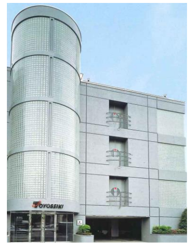
本社ビル（北区滝野川）

現代社会において高分子材料の用途は不可欠なものとして広まっています。当社はそのような高分子材料の高品質化、高性能化のサポートにより、ナンバーワン試験機メーカーを目指しています。