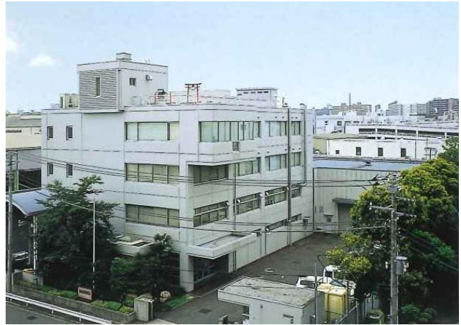
東京工場（北区浮間）