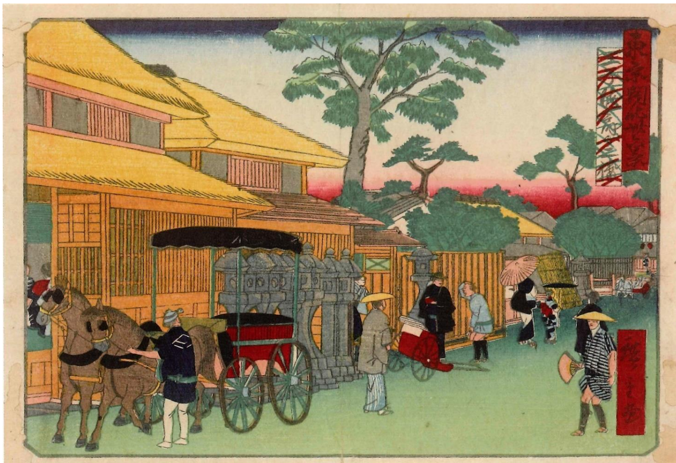
(浮世絵に描かれる北区) 東京開化三十六景 王子海扇乃二楼 (三代 歌川広重 1874年)

表紙の浮世絵は王子の有名料理屋、海老屋(右奥側)と扇屋(手前)の店先を描いた作品です。江戸の料理屋番付でも大関、小結を占め名声を誇っていました。茅葺きの二階建ての建物と巨木が並び、店先には石灯籠が並んでいます。音無川とも呼ばれた石神井川沿いに立ち並ぶ王子料理屋の光景は「江戸名所図会」や多くの浮世絵にも描かれています。(北区飛鳥山博物館所蔵)