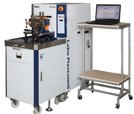
当社の代表的製品「ラボプラストミル」

最近においては、新型コロナウイルス感染症対策にも取り組み、従業員が安心して働ける環境づくりを進めています。