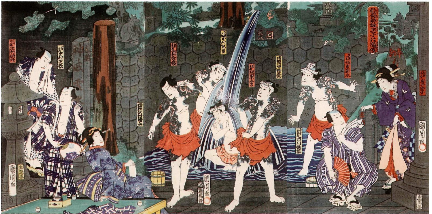
(浮世絵で描かれる北区) 俳優英雄王子の瀧催 (わかつてぞろいわうじのくわだて) (豊原国周 1832年)

(公社)東基連王子労働基準協会支部 〒114-0022 北区王子本町1-22-3 王子工業会館内 TEL 03-5924-3047 FAX 03-5924-3048