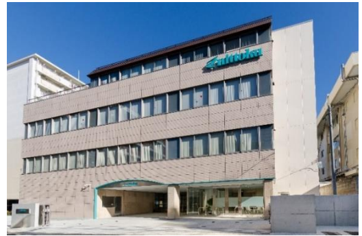
東京本社（北区王子）

事業場名 日本特殊塗料株式会社 所在地 本社：東京都北区王子 3-23-2 設 立 1929年6月 事業内容 塗料、自動車用防音部品の製造及び販売 従業員数 655人