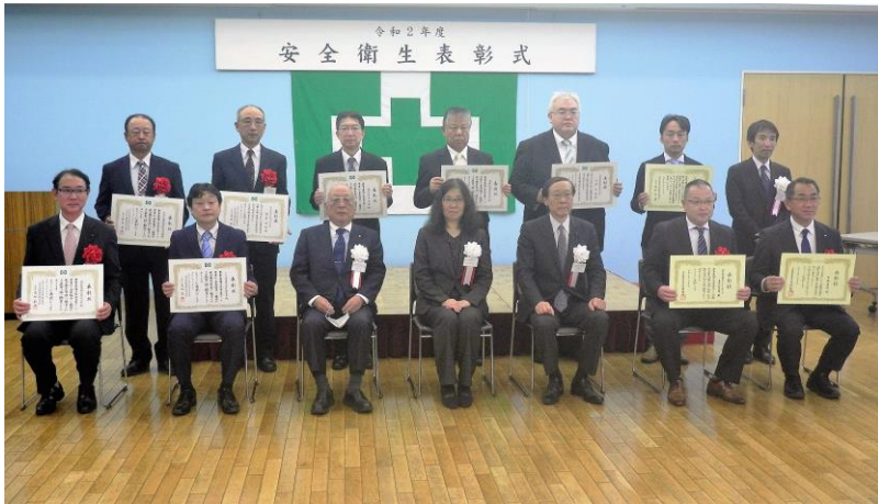
主催者と表彰された皆様方

令和2年11月12日(木)、令和2年度の安全衛生表彰式が王子北とぴあスカイホールにて開催されました。