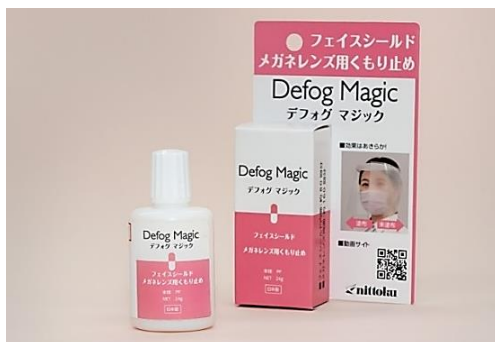
Defog Magic（デフォグマジック）

半期に1度、全社での安全衛生委員会を開催し、各事業所における取組状況を報告し、良い活動は横展開するなど、発展的な活動を行っています。今までは集合型会議として行いましたが、最近はオンラインで行っております。これも、社員のみならず社員のご家族が安心できるよう全社的に取り組んでいる新型コロナウイルス感染症の感染防止策の一つになります。