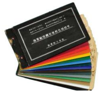
航空機用塗料見本帳 「海軍航空機用塗料色別標準」

自動車製品事業では、音響測定・解析の専門設備を有し、長年にわたり「音」に関する研究を続けております。その研究開発力を強みとし、防音・防錆技術を軸に、多様な部品の開発設計、そしてグローバルな生産体制を構築しています。また、防音材分野においては、古紙・古着などを活用するリサイクル活動にも率先して取り組んでおります。