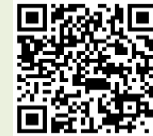
ハローワーク王子 ホームページ